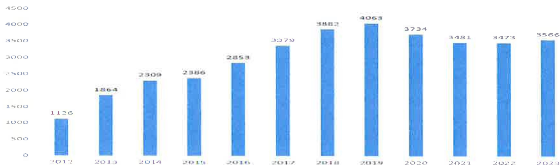
Kunnan lainamäärän kehitys vuosina 2012–2023 (eur/asukas)

Kunnan lainamäärä vuoden 2023 lopussa oli 27,5 milj. euroa eli noin 3 566 euroa asukasta kohden, kun se vuotta aiemmin oli 3 473 euroa.